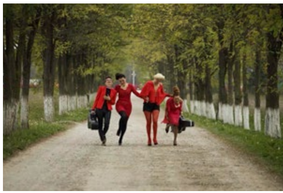
Iz spota „Kad se ljubimo“